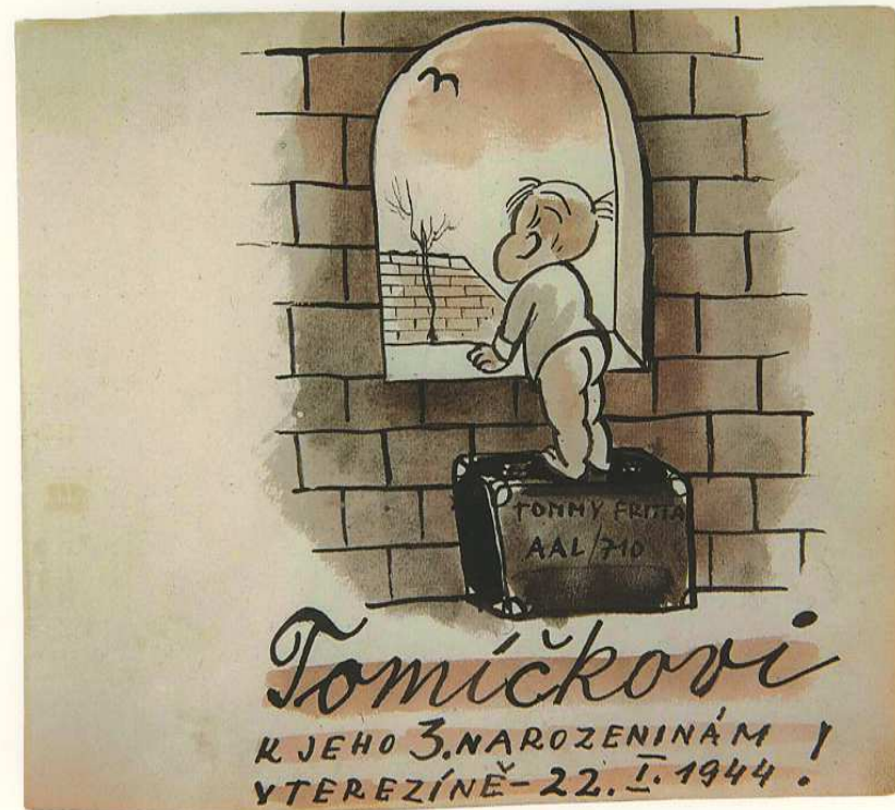
לתומי ליום ההולדת השלישי בטרזין, 22 בינואר 1944